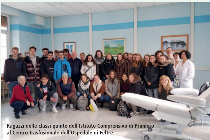
Ragazzi delle classi quinte dell'Istituto Comprensivo di Primiero al Centro Trasfusionale dell'Ospedale di Feltre.

Il 12 gennaio 2019 gli alunni delle ultime classi hanno avuto un incontro con i Responsabili di