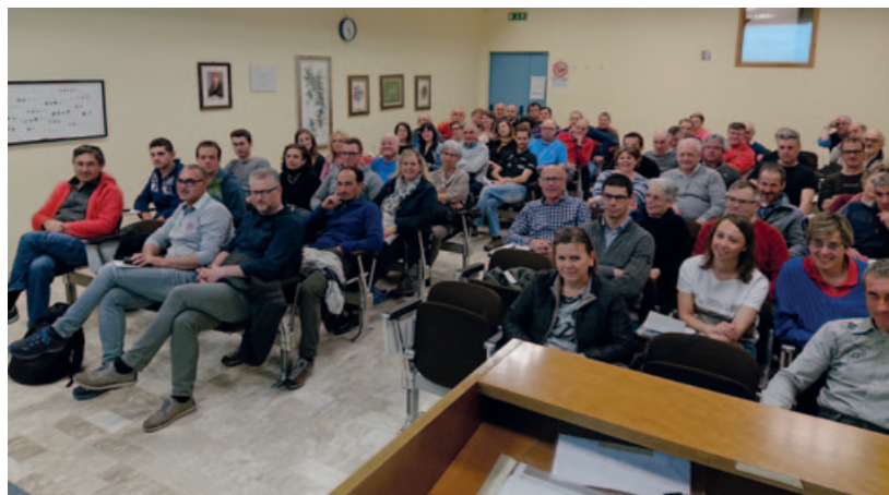
Capisezione e Delegati intervenuti all'annuale appuntamento.