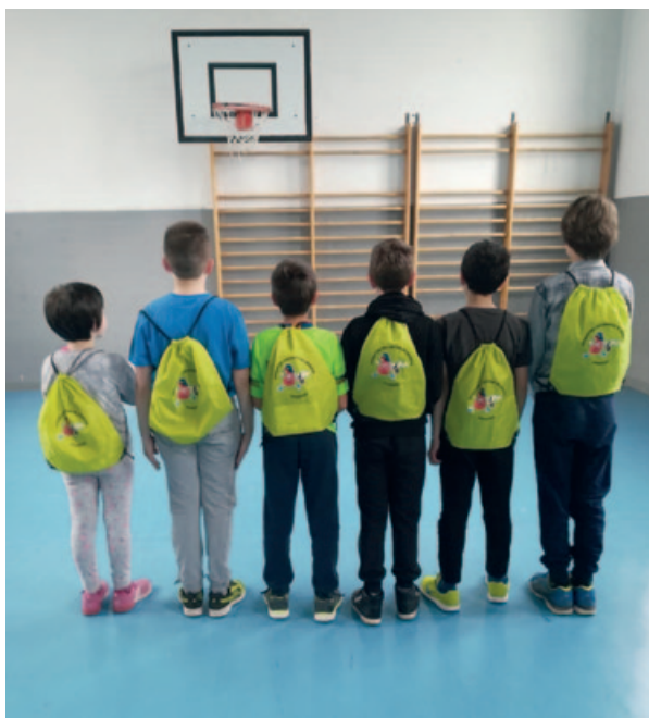
Alcuni ragazzi indossano la sacca regalata dai Donatori di Fonzaso.

Un gruppo di Donatori della Sezione è intervenuto nelle classi per far conoscere ai bambini l’Associazione ed il suo operato, spiegando quanto sia necessario ed importante per la Collettività poter contare su adeguate scorte di sangue presso le Strutture Sanitarie. Da queste riflessioni, contornate anche da in-