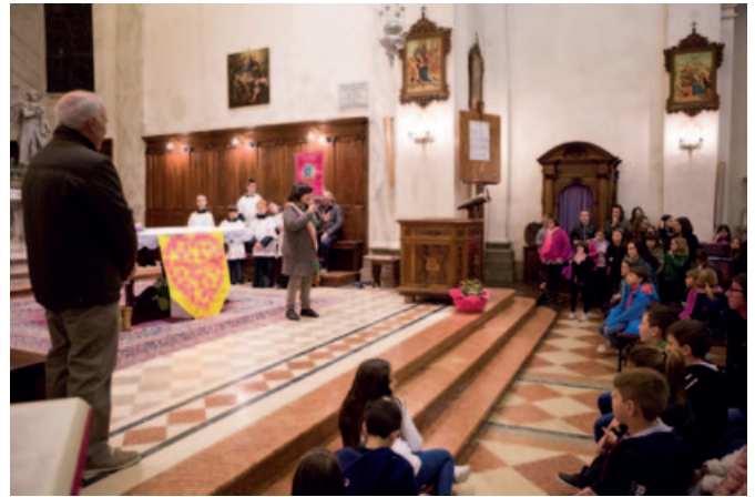
Il Sindaco saluta i giovani intervenuti alla Santa Messa

Sabato 23 marzo la Sezione di Pedavena si è riunita in Assemblea presso la sala della Pro Loco. Il Caposezione ha presentato sia la Relazione economica, approvata dai presenti, che quella morale. Relazioni dalle quali è emerso che la Sezione gode di ottima salute economica ma soprattutto, e per il secondo anno consecutivo, le Donazioni sono, seppur di poco, aumentate. Tenendo conto che nel corso del 2018 non ci sono stati solleciti, l’essere riusciti a migliorare il risultato già ottimo del 2017 è un dato molto positivo che riempie d’orgoglio i Consiglieri e che li ripaga del grande impegno profuso durante tutto l’anno. Altro dato molto importante, per la nostra Sezione, è l’a-