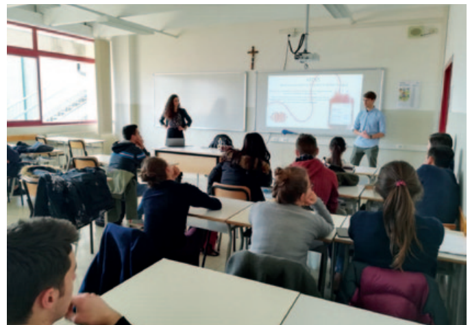
Uno degli incontri presso il Liceo Scientifico "Giorgio dal Piaz".