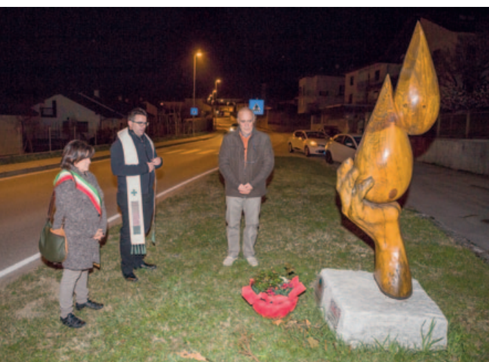
L'omaggio al Monumento al Donatore di sangue